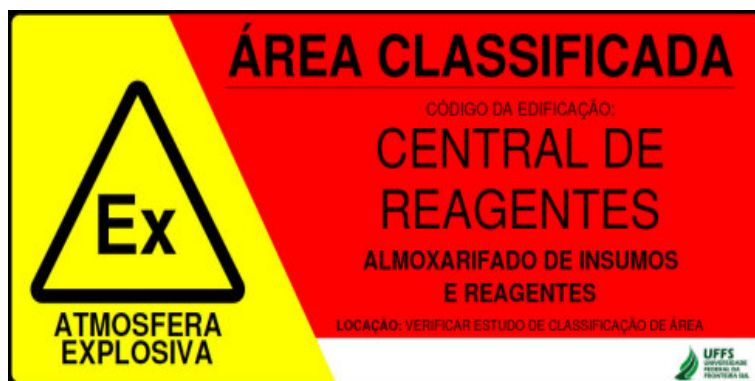
Figura 1 - Leiaute de Placa Tipo I