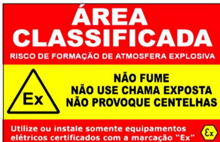
Figura 4 - Leiaute de Placa Tipo II

Modelo 02: Placa de sinalização de área classificada fixada em poste metálico a 5m da edificação no início da área controlada, fotoluminescente, retangular, 35 x 50 cm, em chapa metálica.