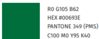
Figura 4 – Códigos do verde padrão UFFS

Ainda, deverá ser executado 1 letreiro trazendo a logomarca institucional da UFFS composto por Letra Caixa PVC Expandido 20 mm com pintura na cor verde padrão UFFS, fontes Eras Bold na descrição UFFS e Fire Sans Condensed no texto “CENTRAL DE REAGENTES”, conforme imagens a seguir. Os conjuntos serão afixados sobre platibanda de alvenaria, com parafusos e buchas, na parte frontal da edificação.